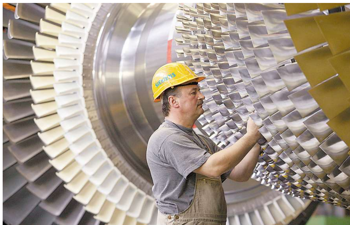
Investitionsgüter aus Deutschland wie diese in Bau befindlichen Gasturbinen der Siemens AG sind vor allem im Ausland gefragt. Doch die Weltbank rechnet 2005 mit einer Abschwächung der weltweiten Exportnachfrage.

Die deutsche Wirtschaft könnte bereits im zweiten Quartal einen neuen Rückschlag erleben, fürchten Volkswirte: „Es gibt ein nicht zu vernachlässigendes Risiko, dass die Wirtschaftsleistung im zweiten Quartal stagniert oder sogar fällt“, sagt Holger Fahrnkrug, Ökonom bei der Schweizer Großbank UBS. „Die Binnennachfrage bleibt wahrscheinlich schwach, und die hohen Ölpreise sind eine ernsthafte Gefahr für die deutsche Konjunktur“, betont auch Holger Schmieding von der Bank of America. Timo Klein, Deutschland-Experte der privaten